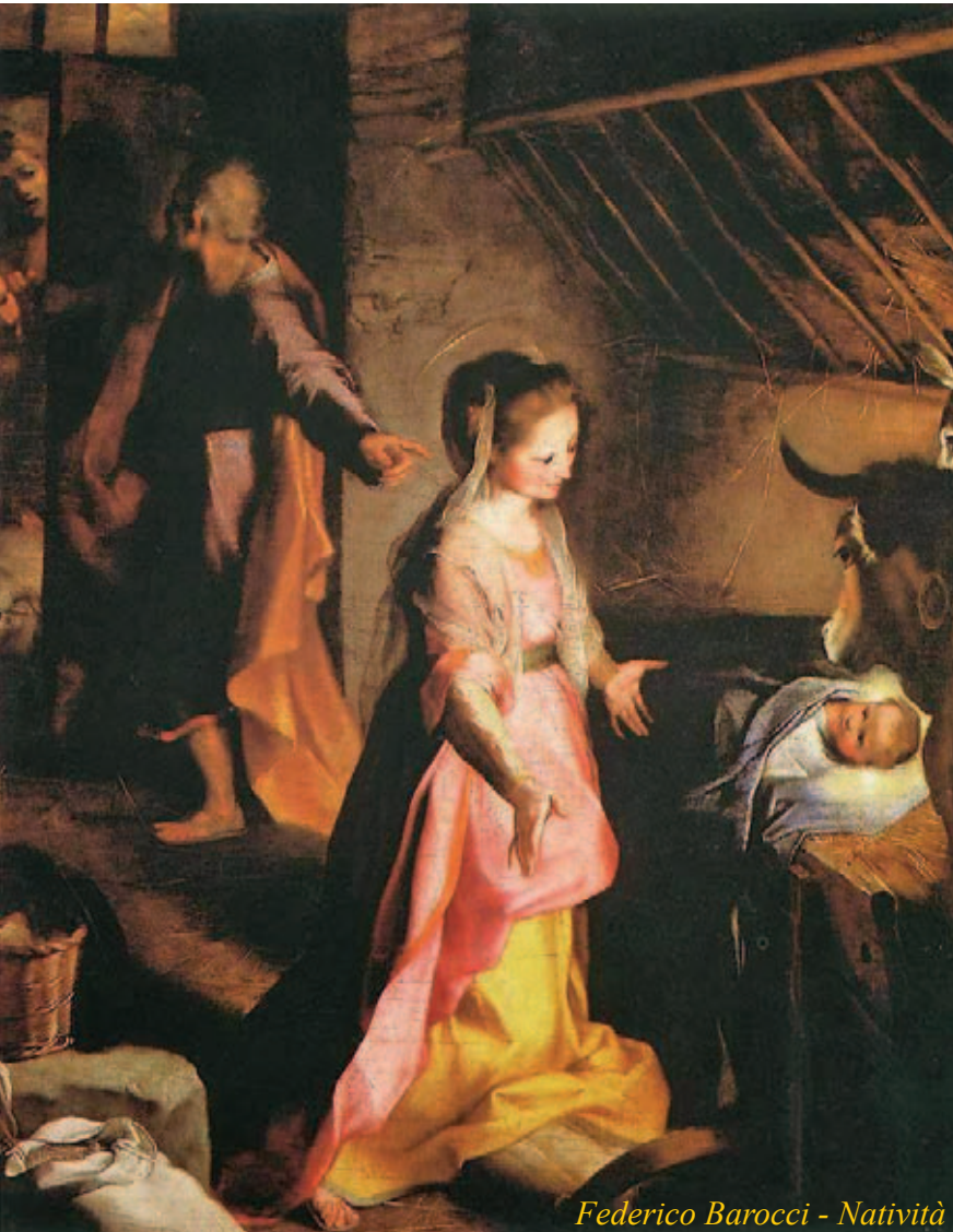
Federico Barocci - Natività