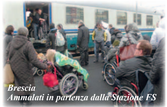
Brescia Ammalati in partenza dalla Stazione FS

Documentandomi su come a Lourdes ci si stia preparando a vivere l'anno Giubilare della Misericordia, ho trovato in Internet un articolo che spiega chiaramente ogni iniziativa. Pongo qui, alla vostra attenzione, qualche aspetto del programma reso noto il 10 agosto 2015, presso l'Emiciclo Santa Bernadette del Santuario Nostra Signora di Lourdes, attraverso una conferenza stampa. A presentare gli eventi che avranno luogo nel santuario mariano dall'8 dicembre 2015 al 13 novembre 2016, è stato padre Xavier