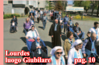
Lourdes luogo Giubilare pag. 10