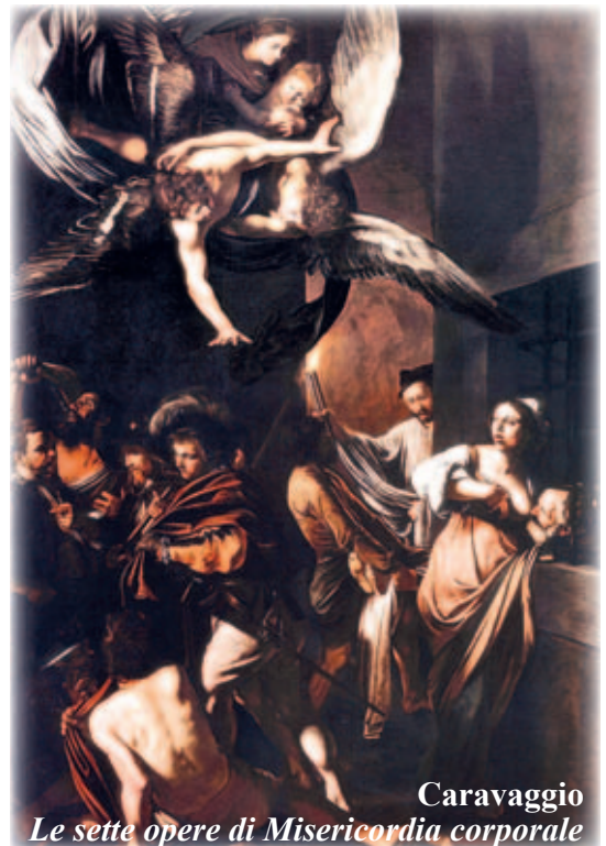
Caravaggio Le sette opere di Misericordia corporale