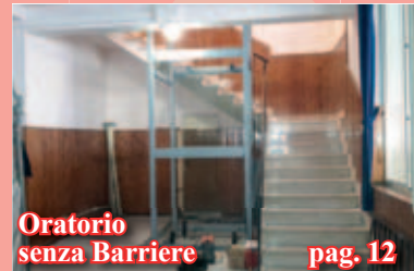
Oratorio senza Barriere pag. 12