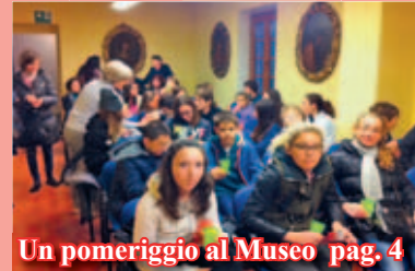
Un pomeriggio al Museo pag. 4